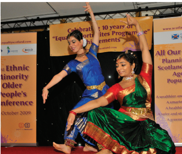
ਭਾਰਤੀ ਸ਼ਾਸਤਰੀ ਨਾਚ