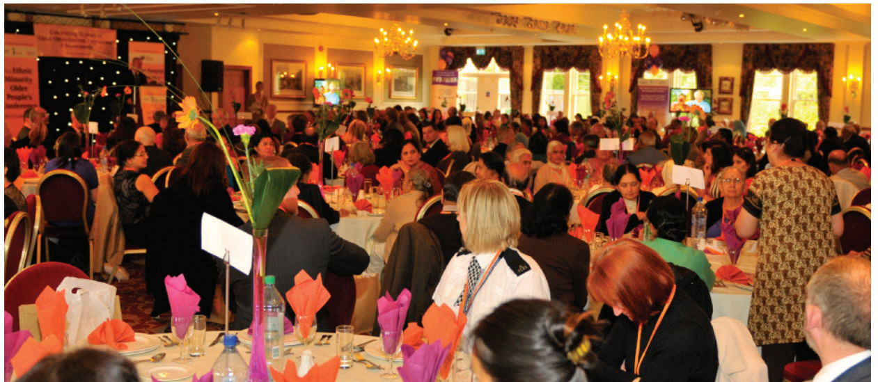
ਕਾਨਫਰੰਸ ਵਿੱਚ ਦੇ ਮਹਿਮਾਨ