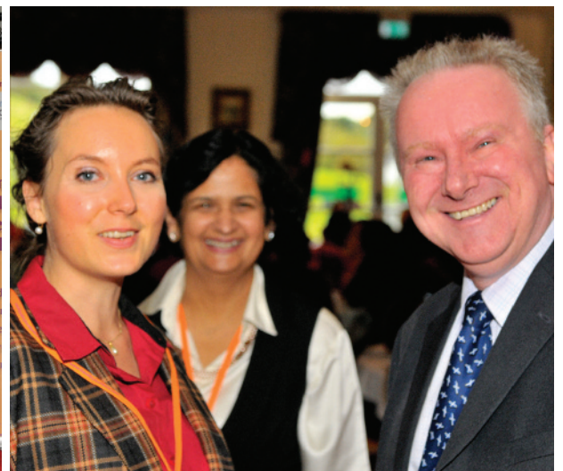
ਭਾਰਤੀ ਸ਼ਾਸਤਰੀ ਨਾਚ